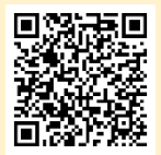
「ラーケーションの日」活動例